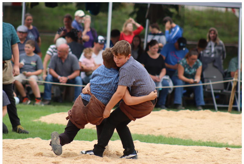
Die Nachwuchsschwinger starten als erste in den Tag, Anschwingen ist für sie um 08.15 Uhr