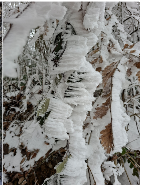
Hagenfirst im Schnee