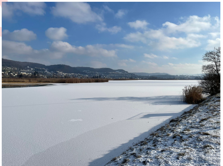
Der teils zugefrorene Staussee im Januar

Montag: 08.30 – 11.30 Uhr / 14.00 – 16.30 Uhr Dienstag: 08.30 – 11.30 Uhr / 14.00 – 18.00 Uhr Mittwoch: ganzer Tag geschlossen Donnerstag: 08.30 – 11.30 Uhr / 14.00 – 16.30 Uhr Freitag: 07.00 – 14.00 Uhr (durchgehend)