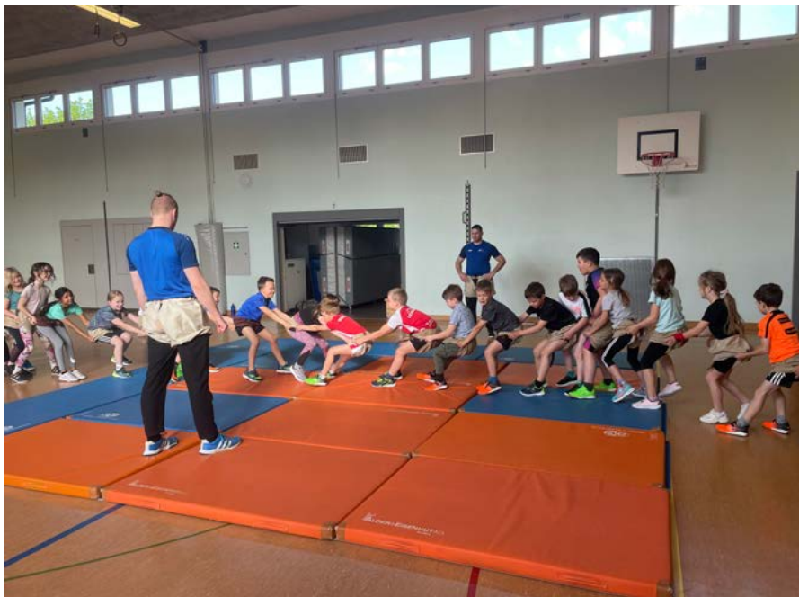
Der Wettkampf wird beim Schwingen sehr gefördert.