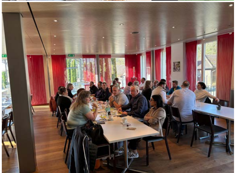
Impressionen vom Gewerbeznüni am 4. April 2026