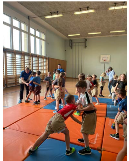
Der «Hosenlupf» wird fleissig geübt.